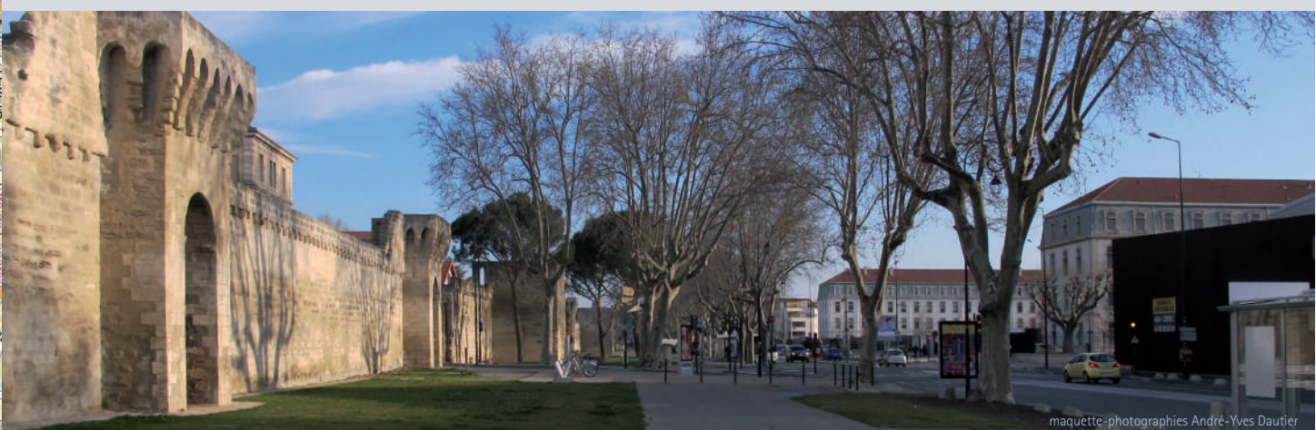
maquette-photographies André-Yves Dautier