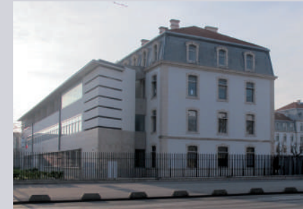
Université régionale des Métiers de l'artisanat V. Gleize, G. Alexandre- 2016