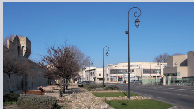
Face au rempart, le Palais de Justice et la Direction de la Vie sociale du Département.