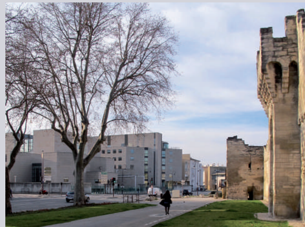
Palais de Justice A. Fainsilber, J.-C. Olivier -2006