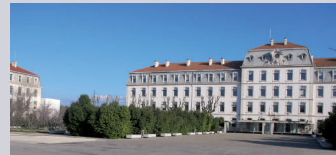
Préfecture ci-dessus, la cour ; ci-dessous, le le raccord du nouveau bâtiment avec l'ancien.