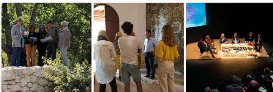
De g. à d. : nos membres durant un atelier In Situ de 2017, notre atelier d'été 2018 entre la France et la Tunisie, nos Entretiens sur le thème « paysages énergétiques » en 2013

Rejoindre l'ONG qui s'intéresse aux villes et aux paysages en Méditerranée. Comprendre et appréhender les enjeux actuels et futurs de nos territoires !