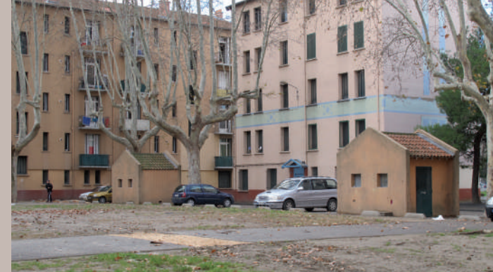
Cité Louis Gros 1932