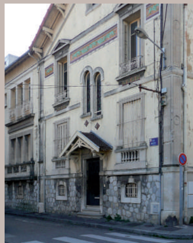
Maison représentative de l'habitat du quartier au début du XXe s. décor céramique, rue Bastet