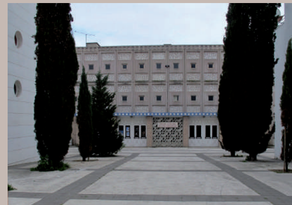
Cité HLM et école Scheppler années 1960