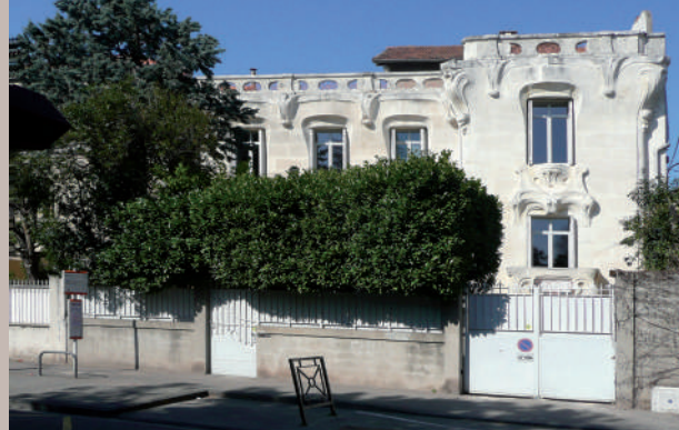
Maison Art Nouveau, 10 avenue Monclar années 1900, Boch architecte