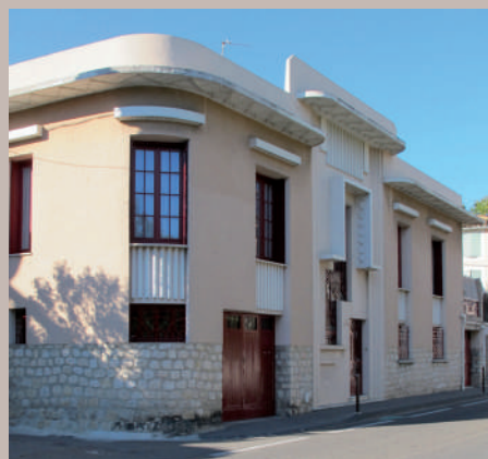
Maison Art Déco, années 1920 8 Bis avenue Monclar